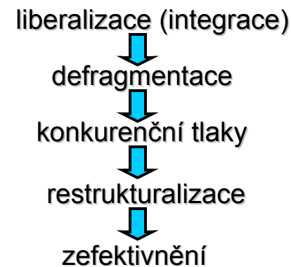
Schéma zefektivnění odvětví