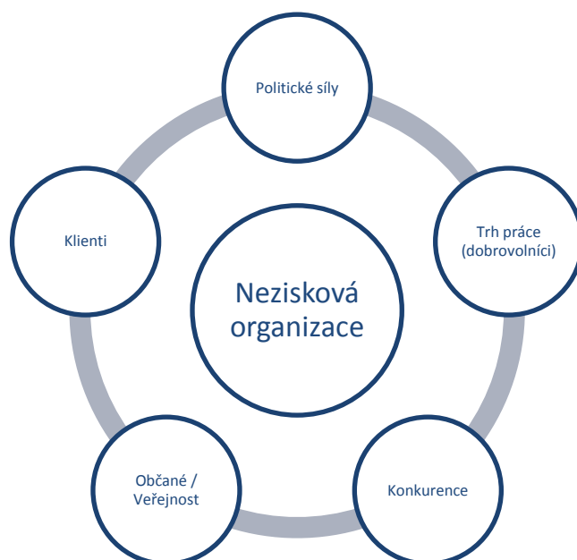
Obrázek č. 4: Model pěti sil dle Joyce

V této obměně zůstávají dodavatelé (= klienti), odběratelé / zákazníci (= občané) a srovnatelné společnosti (= konkurence), další kategorie jsou nahrazeny skupinami „trh práce“ a „politické síly“. V případě festivalu YFY nemá příliš smysl zabývat se trhem práce z pohledu počtu zaměstnaných, protože v dohledné nepředpokládáme, že by YMCA Brno najala zaměstnance v rámci festivalu YFY. Mnohem příhodnější se nám zdá uvažovat o roli dobrovolníků namísto trhu práce.