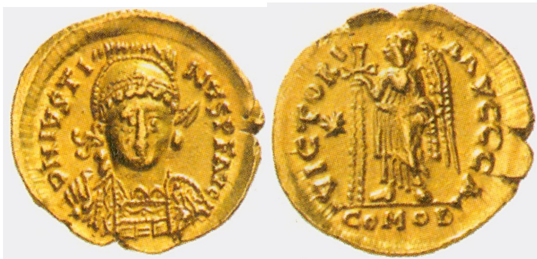
Obr. 1. Solidus Athalaricha I. (526-534), napodobenina solidu Justina I. (526-527). Mincovna Ravenna, 4,53 g.

Ačkoliv Byzantská říše postupně slábla, vliv zlatých solidů je v dálkovém obchodě v západní Evropě nepřehlédnutelný až do 12-13. století, kdy byly nahrazeny zlatými mincemi západoevropskými.