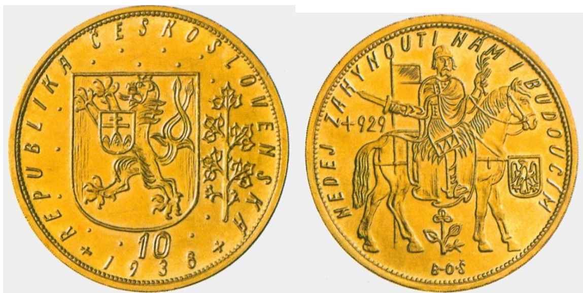
Obr. 14. Československo, 10 dukát 1936, mincovna Kremnica, 34,41 g.