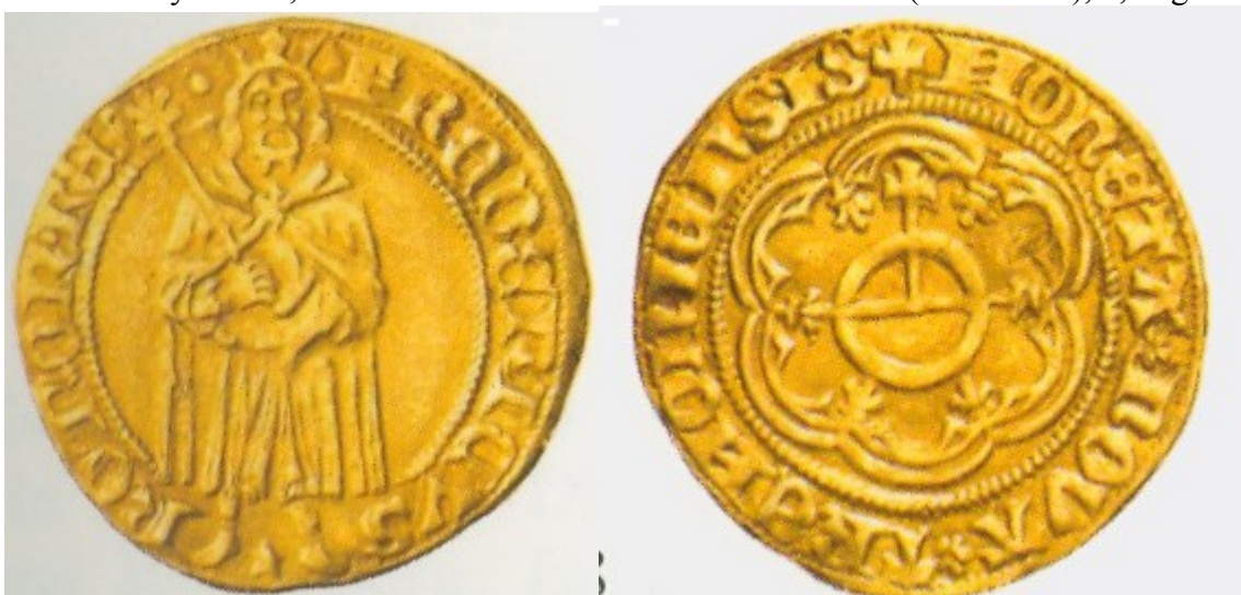
Obr. 3 Florén