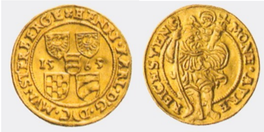
Obr. 8. Dukat Heinricha III. a Karla II. vévodů minsterberských (1562-1587), 1565 mincovna Reichenstein (dnes Rychleby), 3,54 g.

V zemích Koruny české mělo od středověku tradici mincování ve Slezsku. Město Vratislav razilo v roce 1531 goldguldeny a pokračovalo v dalších letech ražbou dukátů a dvodukátů. Krátce zde razili i tolary, ale zlaté ražby Vratislav razila i v 17. století.