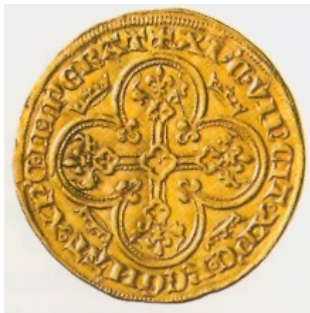
Obr. 3. Royal d'or , zlatá mince francouzského krále Karla IV. (1322-1328), 4,13 g.