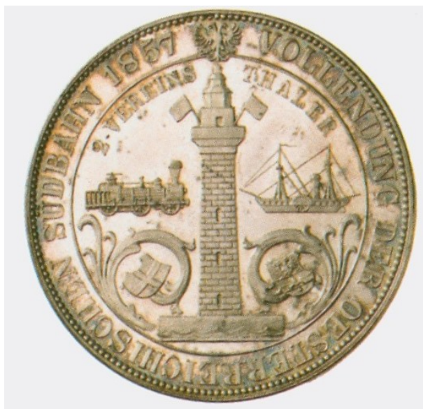
Obr. 13. Spolkový 2 tolar Františka Josefa I. (1848-1916), 1857, mincovna Vídeň. Pamětní mince na dokončení Jižní dráhy, rubní strana.

Zavedení rakouské změny mělo odstranit nedostatky dosavadního oběživa a současně bylo reakcí na měnící se vnější politické a ekonomické podmínky. Rakousko, které se zapletlo v roce do Krymské války (1854-1856), z ní vyšlo oslabeno. Reformou byl pověřen ministr financí Karel Ludvík von Bruck. Reforma byla rozložena do několika kroků.