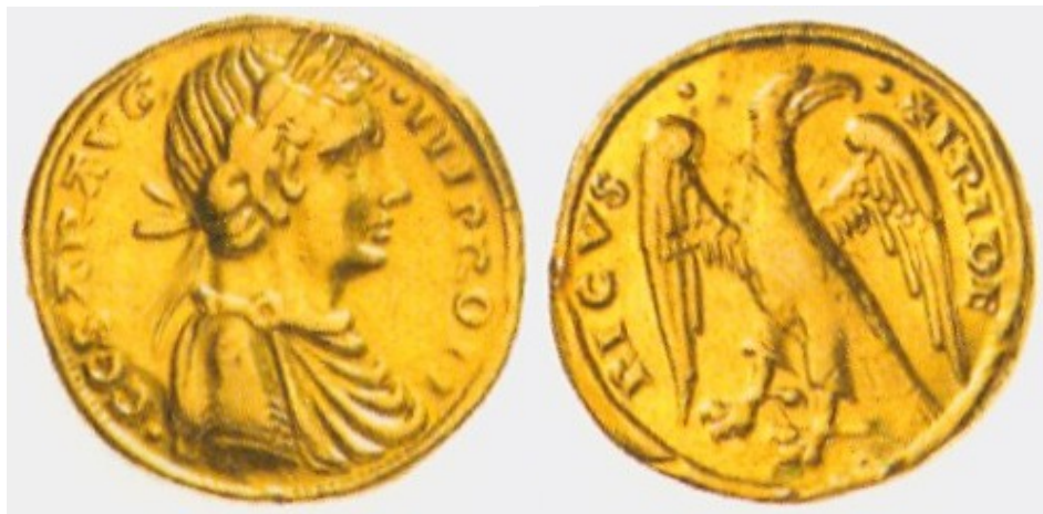
Obr. 2. Augustalis císaře Friedricha II. (1197-1250), po r. 1231, 5,24 g.

Zlaté mince se změnou obrazu byly raženy i za Karla z Anjou (1266 – 1285) v Brindisi, kde real d'oro měl hmotnost 5,29 g a ryzost 20,5 karátů a v Neapoli carlino d'oro 4,34 g a 24 karátů. Byla vydávána i jeho polovina.