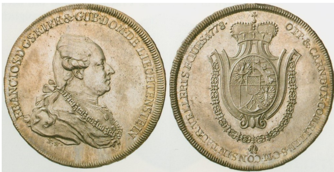
Obr. 10. Tolar Františka Josefa z Lichtenštejna (1772-1781), 1778, 29,71 g.

V Čechách získali obnovené mincovní právo Šlikové, ale i oni využívali v poslední fázi svého mincování služeb vládní mincovny v Praze.