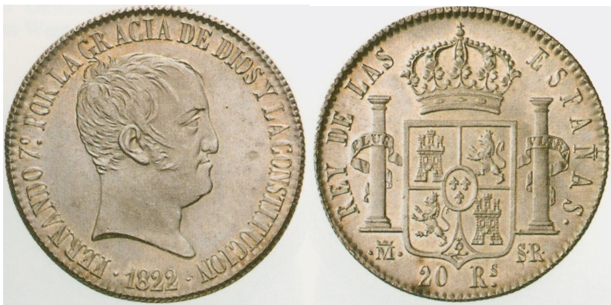
Obr. 11. 20 real španělského krále Ferdinanda VII. (1808-1833), 1822, mincovna Madrid, 26,90 g. Rubní strana s motivem tzv. Heraklových sloupů, předobrazem pro značku dolaru.