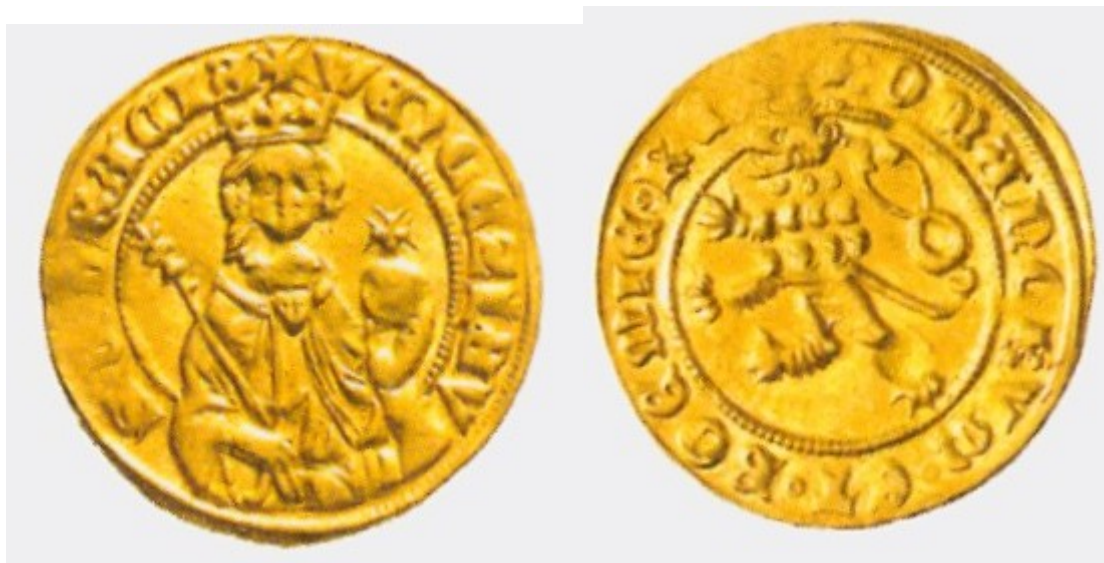
Obr. 12. Dukát římského a českého krále Václava IV. (1378-1419), mincovna Praha, 3,49 g.

Tento vývoj měl i své stíny a krize. Ryzost a hmotnost pražského groše byla postupně zhoršována a snižována. Vládci českého státu se v tom nelišili od svých současníků. Nemusíme sledovat podrobněji tento vývoj, stačí připomenout jeho hlavní momenty.