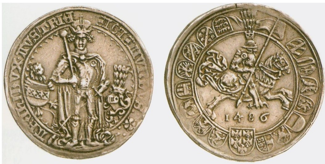
Obr. 5. Guldiner tyrolského hraběte Zikmunda (1446-1496), 1486, mincovna Hall v Tyrolsku, 31,82 g.

(Toto pojmenování se datuje již od roku 1271 podle obrazu spojeného velkého a malého kříže. Krejcar se stal velmi rozšířeným mincovním nominálem včetně svých násobků, zejména v zemích habsburského soustátí a v jižních německých zemích. V četných proměnách platil až do zavedení korunové měny roce 1892.)