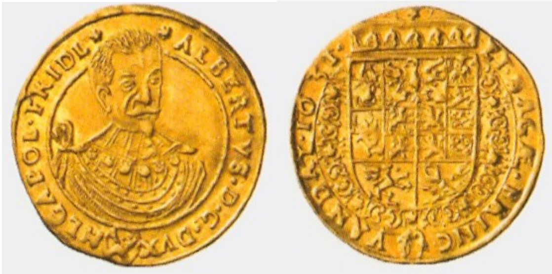
Obr. 9. Dukat Albrechta z Valdštejna (1625-1634), 1631, mincovna Jičín, 3,43 g.

Krátkou kapitolou bylo mincovnictví Albrechta z Valdštejna jako knížete zaháňského v letech 1629-1631). Valdštejn měl svou další mincovnu v Jičíně. V roce 1647 získal právo razit mince v Záhani Václav Eusebius z Lobkovic.