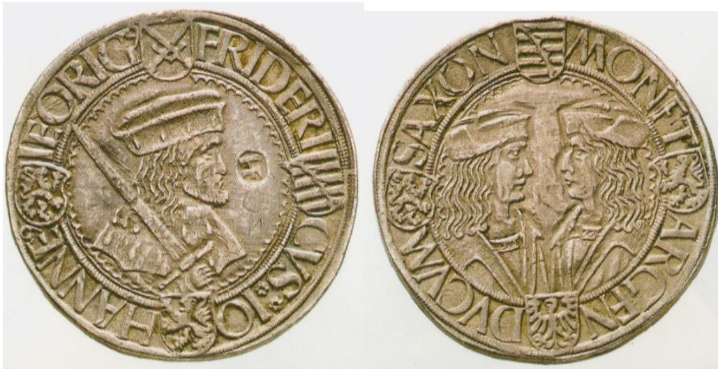
Obr. 6. Tolar saského kurfiřta Friedricha III., Jana a Jiřiho (1507-1525), nedat., mincovna Annaberg, 29,10 g.