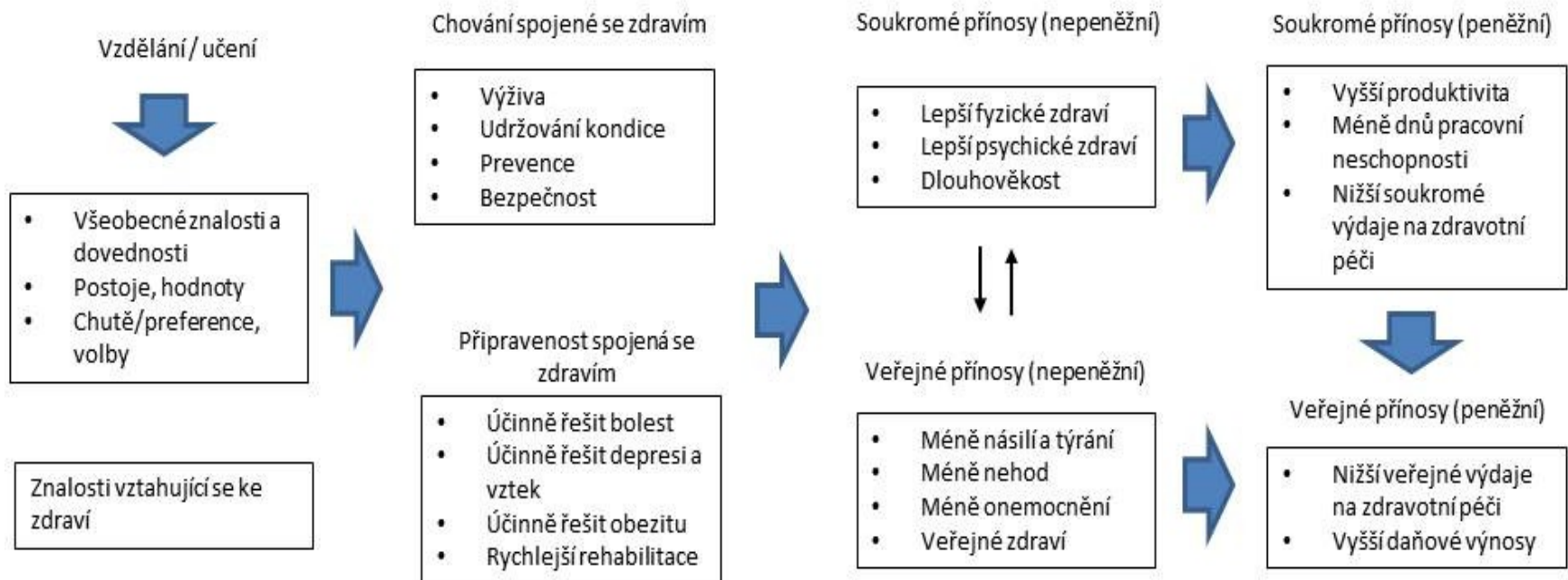
Obr. Základní prvky, které spojují učení se zdravím