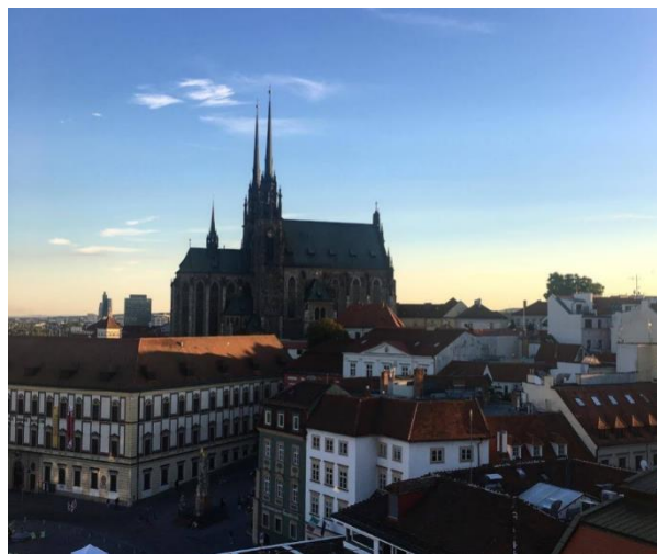
Obr.4: Výhled ze Staré radnice na Petrov Autor: Anna Frintová (2020)

Zelný trh neboli Zelnák se nachází pár kroků od katedrály Petrov. V létě je známý jako tržiště, kde naleznete čerstvou lokální zeleninu, ovoce a květiny. Jako trh slouží již od 13. století. Krásný výhled je na něj právě ze Staré radnice také ze 13. století, která slouží nejen jako vyhlídková věž, ale také jako informační a historické centrum. V útrobách radnice lze zjistit mnoho cenných historických faktů o Brně. Největší zážitek je západ slunce na této věži, ze které je nádherný výhled na celé Brno.