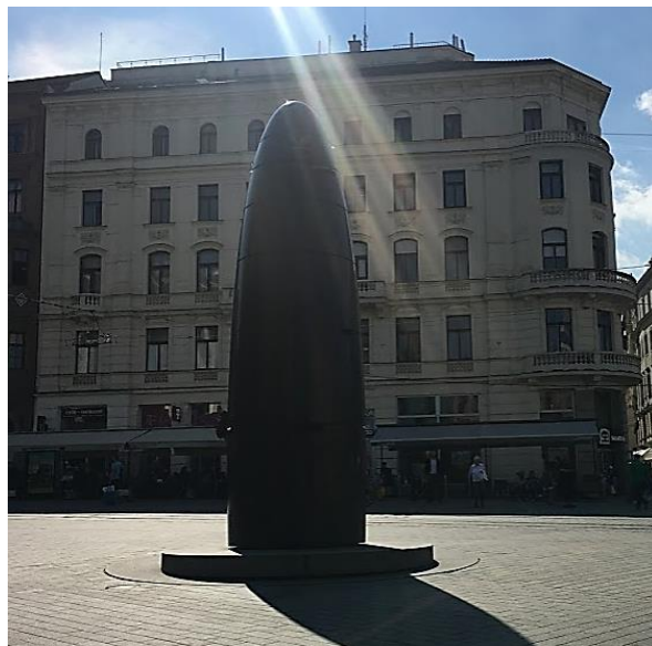
Obr.6: Brněnský orloj, náměstí Svobody Autor: Anna Frintová (2020)

Naleznete ho právě na náměstí Svobody a rozhodně nelze přehlédnout. Pokud stojíte o peprnější popis tohoto skvostu, restaurace Zlatá Loď má excelentní zpravodaj na každém stole. V letních měsících to na tomto náměstí obzvlášť žije. Pro návštěvníky jsou zde lehátka a lze zde popíjet pivo v doprovodu pouličních umělců.