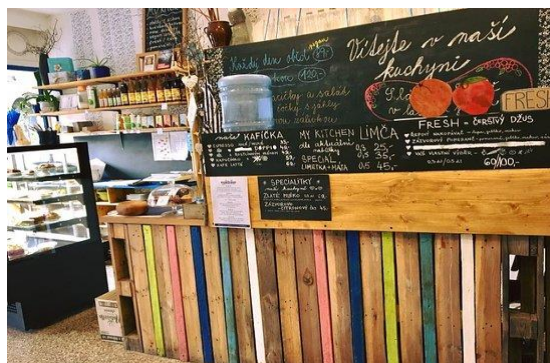
Obr.7: My Kitchen, Brno

Pochutnat si zde lze na raw dortících nebo skvělých snídaních. V nabídce najdete také kávu, čaj, hummus, pomazánky a tortilly. Vše samozřejmě za přijatelný peníz.