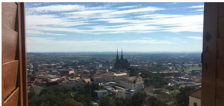
Obr.2: Výhled na Brno z vyhlídky na Špilberku Autor: Anna Frintová (2020)

Značnou výhodou Špilberku je poloha. Pevnost se nachází v centru Brna, tudíž pokud zvolíte ubytování blízko centru, můžete využít té nejudržitelnější dopravy – svých nohou. Zejména v letním období je také centrem kulturních akcí jako např. divadelní představení, festivaly nebo koncerty. Příkladem jsou známe Letní