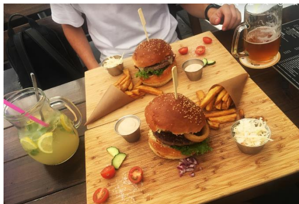
Obr.7: Ukázka burgeru z Parodie Autor: Anna Frintová (2020)

Tady vegan musí přivřít oči, protože sem se chodí jediné na burger a pivko. Pověstné burgery tady podávají s pečlivě vybranými pivy z lokálních minipivovarů. Navíc je zde na výběr několik druhů této americké pochoutky, takže si jistě vybere každý. Pokud máte chuť na nealko, to umí taky. Delikátní domácí limonády potěší každého.