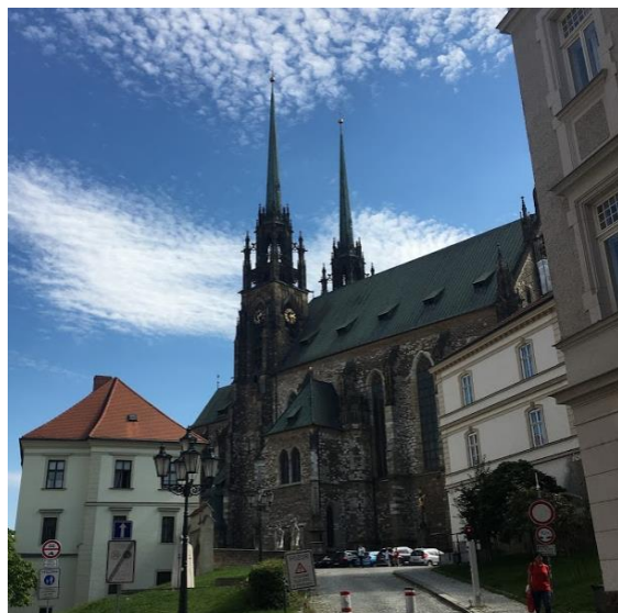
Obr.3: Petrov, Brno Autor: Anna Frintová (2020)

Petrov se nalézá v centru, tudíž srdce udržitelně smýšlejícího návštěvníka opět zaplesá – dostanete se sem bez problému pěšky. Snoubí se zde kultura s adrenalinem, jelikož vyhlídky z tohoto barokního skvostu nejsou pro ty, co trpí strachem z výšek. Rozhodně však nemůžete opustit Brno, aniž byste tento architektonický skvost nespatriili.