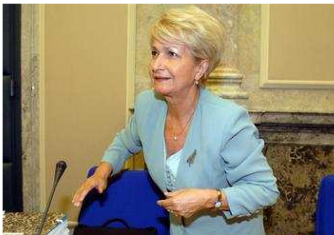
Ministryně zdravotnictví Milada Emmerová

PRAHA 1. listopadu (ČTK) - Ministryně zdravotnictví Milada Emmerová (ČSSD) představila deset hlavních bodů z koncepce, podle níž se má v budoucnu řídit české zdravotnictví. Desatero počítá mimo jiné s léčbou, jež bude pro všechny pacienty ekonomicky, místě i časově dostupná. Lékaři však zveřejněný materiál považují za příliš obecný a v příznivý efekt koncepce většinou nevěří. Zároveň ani nedoufají, že se Emmerové podaří koncepci prosadit. Desatero klade důraz na zajištění rovnocenné péče na celém území republiky, vytvoření sítě nemocnic či zajištění vyrovnaného vícezdrojového financování. Za hlavní cíl ministryně považuje vytvoření sítě lůžkových zdravotnických zařízení. Síť ambulancí je totiž podle ní již dávno hotová. Zdůraznila také, že praktičtí a nemocniční lékaři musejí více spolupracovat.