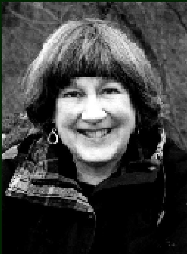
Donella Meadows 13.3.1941 – 20.2.2001