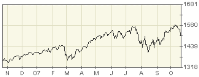
Stock Price in Dollars