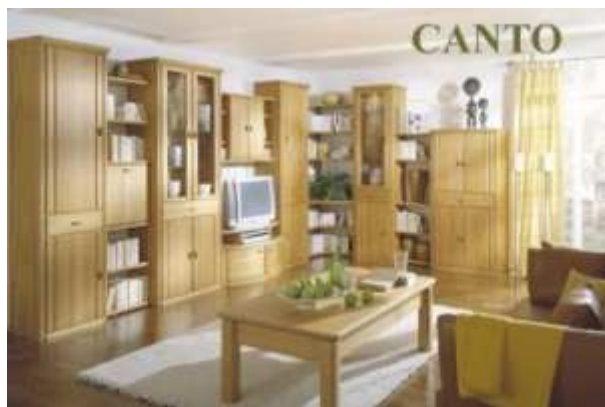
Obr. 1 Kompletní pohled na obývací systém