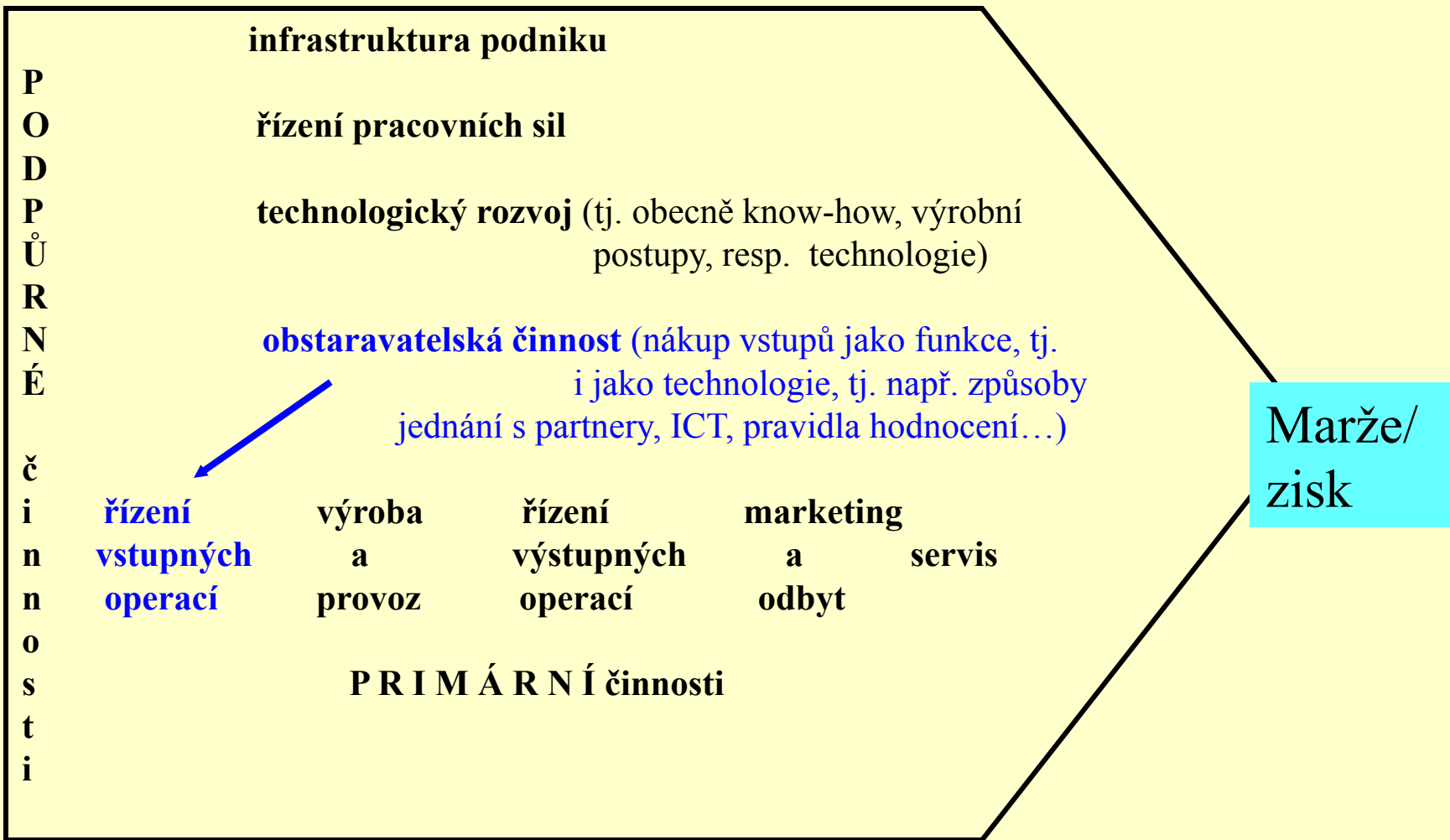
Hodnotový řetězec (M. Porter)