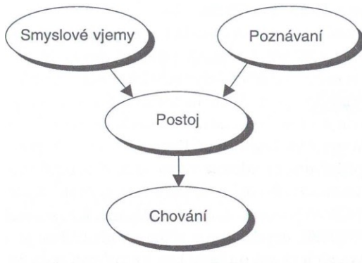
Obr. 3.2 Komponenty postoje

Na příkladu lze dokumentovat rozdíl mezi komponenty. Můžete mít v oblibě boty od firmy Clarks (smyslový, pocitový komponent), protože víte, že jsou pohodlné a dlouho vydrží (poznávací komponent), a proto si při příštím nákupu koupíte nové boty opět u Clarks (komponent chování). Chtějí-li marketéři změnit postoj, měli by se soustředit na změnu výše uvedených komponentů. Komunikační kampaň zaměřená na ovlivňování smyslového a pocitového světa zákazníků často používá emocionální reklamu s velmi omezenými informacemi o produktu. Miele může měnit zákaznické názory a hodnocení tím, že zdůrazňuje kvalitu a životnost svých spotřebičů pro domácnost. Marketingová komunikace pak uplatní mnoho silných argumentů k ilustraci řady přínosů výrobků Miele. Coca-Cola může realizovat podpůrnou kampaň, během níž zákazníci získají atraktivní Coke mobilní telefony nebo Coke pohovky za určité množství uzávěrů od lahví. Firma tak vyvolává chuť zákazníků koupit, a to co nejvíc.