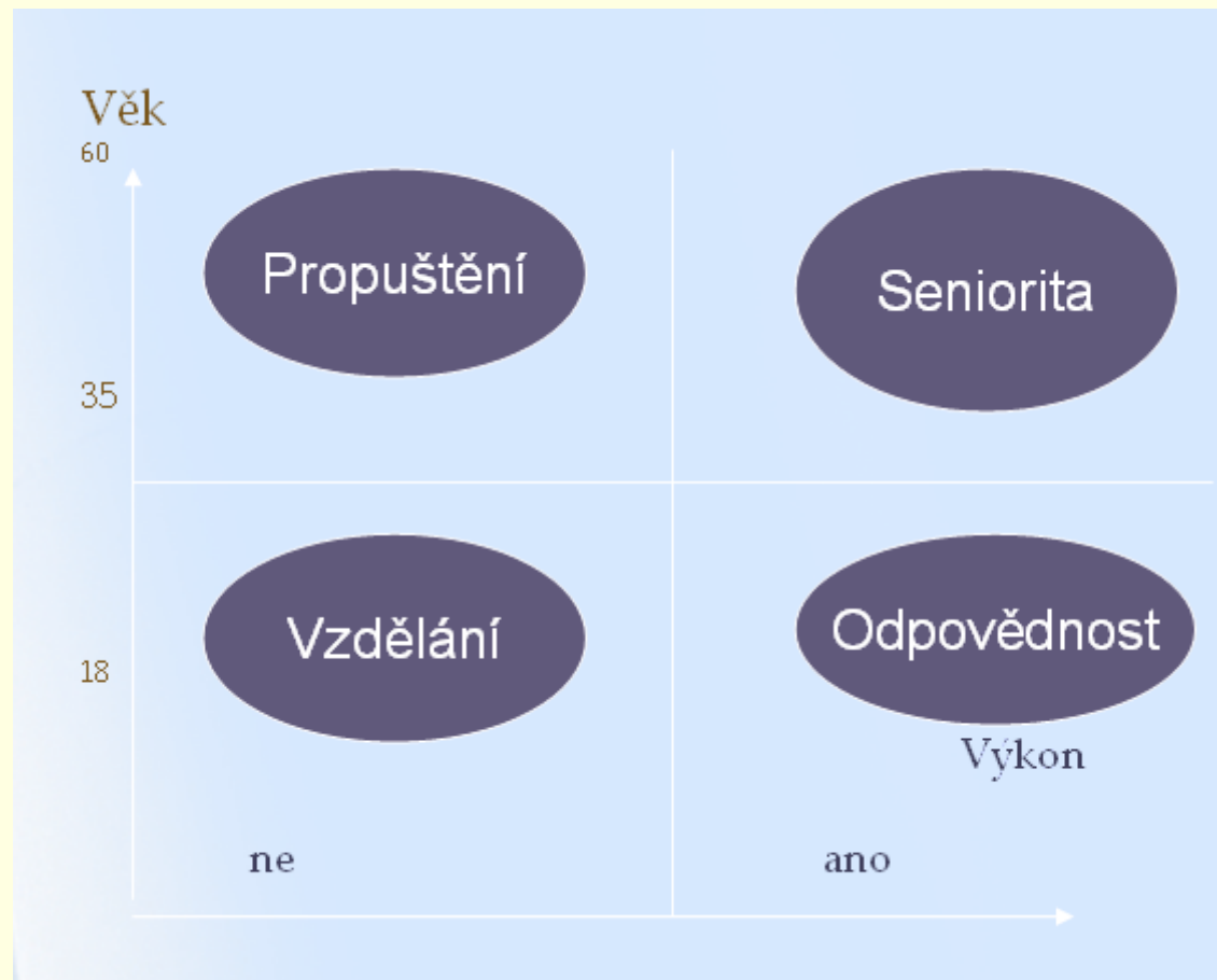
Schéma zohledňující výkon a věk pracovníka