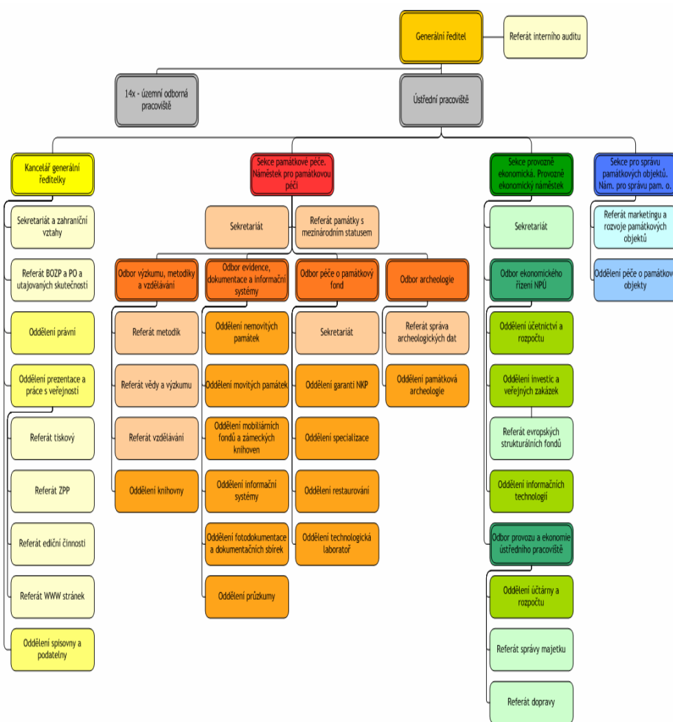
Obr.2.3 : Struktura NPÚ, ústředí pracoviště Praha, aktuální stav k 07 2008