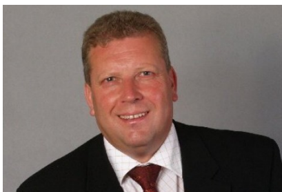
Obr.2.1 Ministr kultury ČR- MUDr. Jiří Besser.

Ministrem kultury je v současné vládě premiéra Nečase MUDr. Jiří Besser . Pro státní kulturní politiku není optimální častá změna na postu ministra. (V minulém období byl ministrem kultury Prof. Václav Riedlbauch, před ním Mgr. Václav Jehlička)