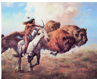
bizoni na pláních (a jiná migrující zvířata)