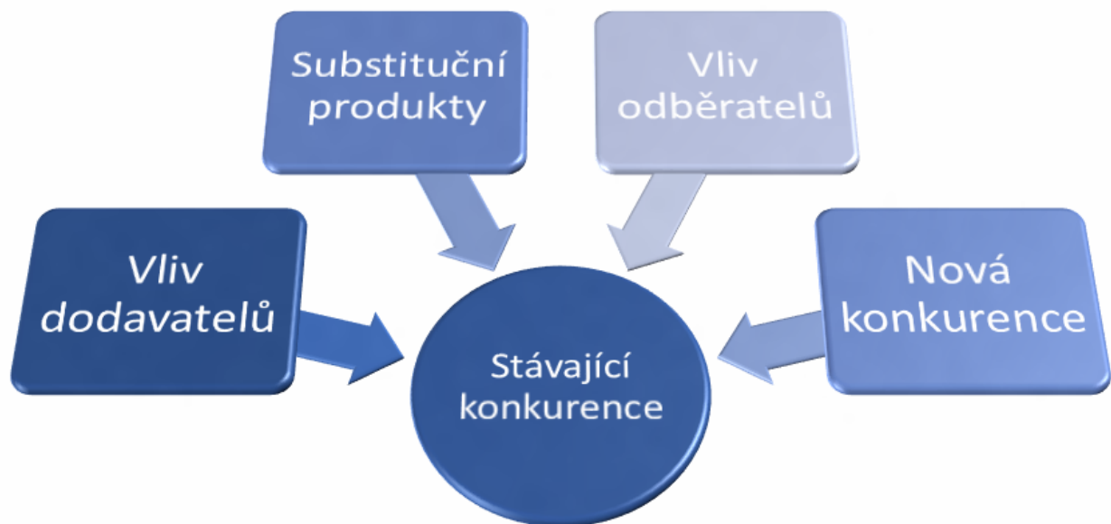
Obrázek 1: Schéma Porterovy analýzy 5-ti sil

Porterova analýza, stejně jako celá řada dalších důležitých teorií a manažerských nástrojů, pochází z Harvard Business School, kde ji v roce 1979 zformuloval profesor Michael Eugene Porter. Ten se zabýval otázkou toho, jaké vnější síly ovlivňují podnikání firem. Definoval přitom celkem 5 sil, které bezprostředně ovlivňují podnikání firem v daném odvětví – konkurenční rivalitu, hrozbu vstupu nových konkurentů na trh a hrozbu vzniku substitutů, což jsou faktory zabývající se obecně konkurencí na trhu, a pak (vyjednávací) sílu kupujících a sílu dodavatelů, která ovlivňuje tvorbu cen na daném trhu. Porterova analýza pěti sil byla vytvořena v reakci na populární SWOT analýzu, kterou Porter považoval jako příliš obecnou a hrubou. Tu se mu však nepodařilo nahradit, v praxi jsou dnes používány obě.