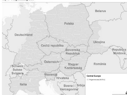
Map 1: Programming area