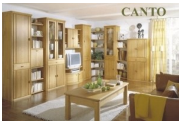
Obr. 1 Kompletní pohled na obývací systém