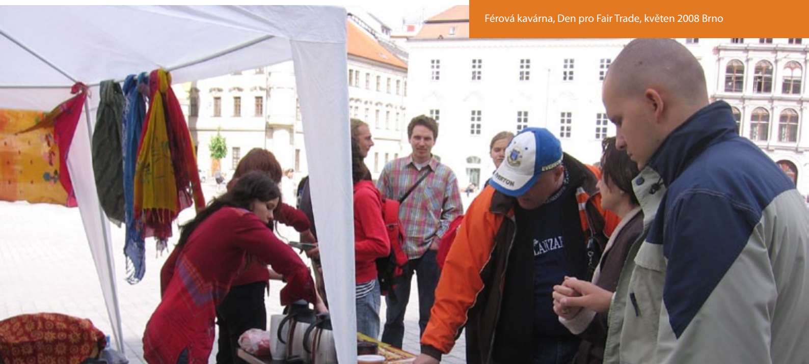
Férová kavárna, Den pro Fair Trade, květen 2008 Brno

Do budoucna bude dobré propracovat lepší informační i organizační podporu už dosti širokých aktivit místních skupin. Tím spíše, že s radostí očekáváme vznik dobrovolnických skupin v dalších místech republiky.