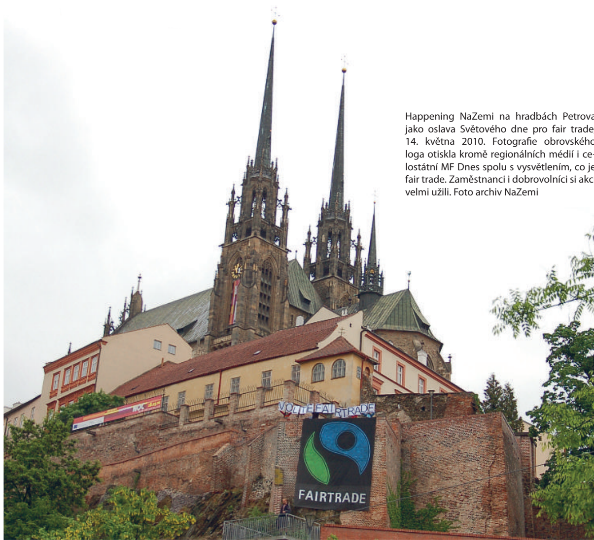
Happening NaZemi na hradbách Petrova jako oslava Světového dne pro fair trade, 14. května 2010. Fotografie obrovského loga otiskla kromě regionálních médií i celostátní MF Dnes spolu s vysvětlením, co je fair trade. Zaměstnanci i dobrovolníci si akci velmi užili.

Protože význam maloobchodních řetězců v distribuci fairtradových výrobků rychle roste (zapojily se již Tesco, Kaufland, Globus, Spar a Makro), zaměřili jsme se v roce 2010 nově také na jednání s hypermarkety a supermarkety.