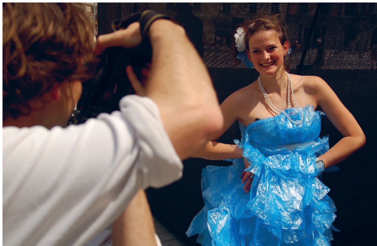
„Den bez klimatizace“ nebo „Labutí píseň bangladéšské dívky“, i tak se jmenovaly modely studentek brněnského Gymnázia P. Křížkovského pro Nemódní přehlídku, která upozornila na nepřijatelné pracovní podmínky v textilním průmyslu. Pro vytvoření modelů použily studentky různé materiály – od igelitových tašek přes bublinkovou fólii až po králíčí pletivo.