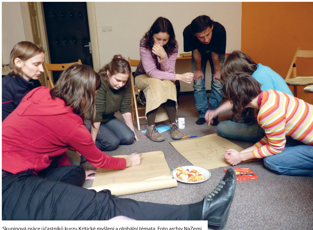
Skupinová práce účastníků kurzu Kritické myšlení a globální témata.