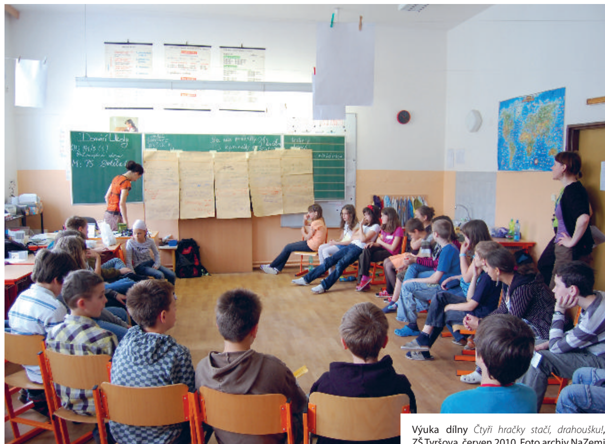
Výuka dílny Čtyři hračky stačí, drahoušku!, ZŠ Tyršova, červen 2010.

Za minulý rok jsme odučili výukové programy pro 3196 žáků, což je 100% nárůst přímých realizací dílen na školách oproti minulému roku. Naši nabídku jsme rozšířili o tři nové dílny. Dvě z nich založily nový vzdělávací cyklus Jinýma očima , který se oproti cyklu Svět v nákupním košíku zaměřuje na práci s rozmanitostí a různými perspektivami. S novým cyklem jsme rozšířili naši cílovou skupinu žáků o 5. a 6. ročníky základních škol.