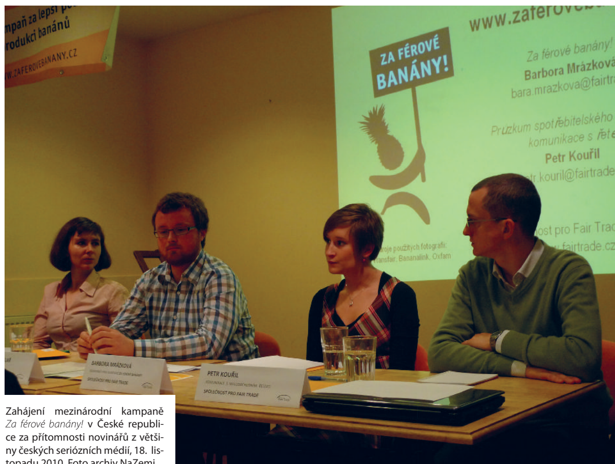
Zahájení mezinárodní kampaně Za férové banány! v České republice za přítomnosti novinářů z většiny českých seriózních médií, 18. listopadu 2010.

V neposlední řadě aktivně působíme v zastřešující organizaci Asociace pro fair trade, která spravuje známku Fairtrade® v ČR. NaZemi je zakládajícím členem Asociace a cítí za její dobré fungování spoluodpovědnost. Dobrým příkladem spolupráce je příprava kampaně Fairtradová města , která byla oficiálně odstartována v lednu 2011. Samotná města a obce jsou pro nás noví partneři, kteří mohou komunikovat fair trade svým občanům a také spolupracovat s místními organizacemi se zájmem o fair trade. Na jednání s městy se chystáme především v roce 2011.