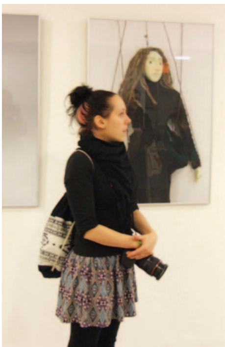
V HaDivadle vystavují studenti oboru Nová média SUŠ v Brně (více na str. 9)