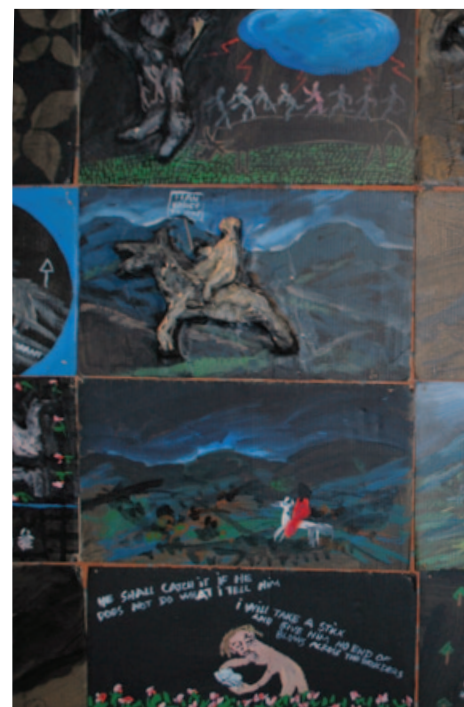
Radikální divadlo včera a dnes, Galerie Provázek (více na str. 2)