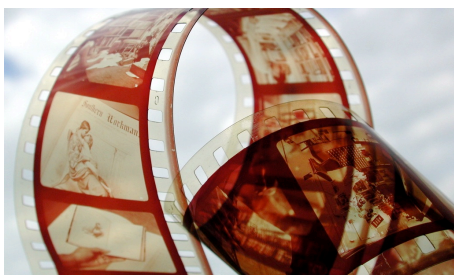
Podpora kultury a zachování kulturního dědictví