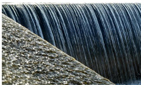
Podpora místní infrastruktury