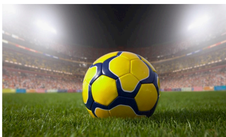
Podpora sportovní a multifunkční rekreační infrastruktury