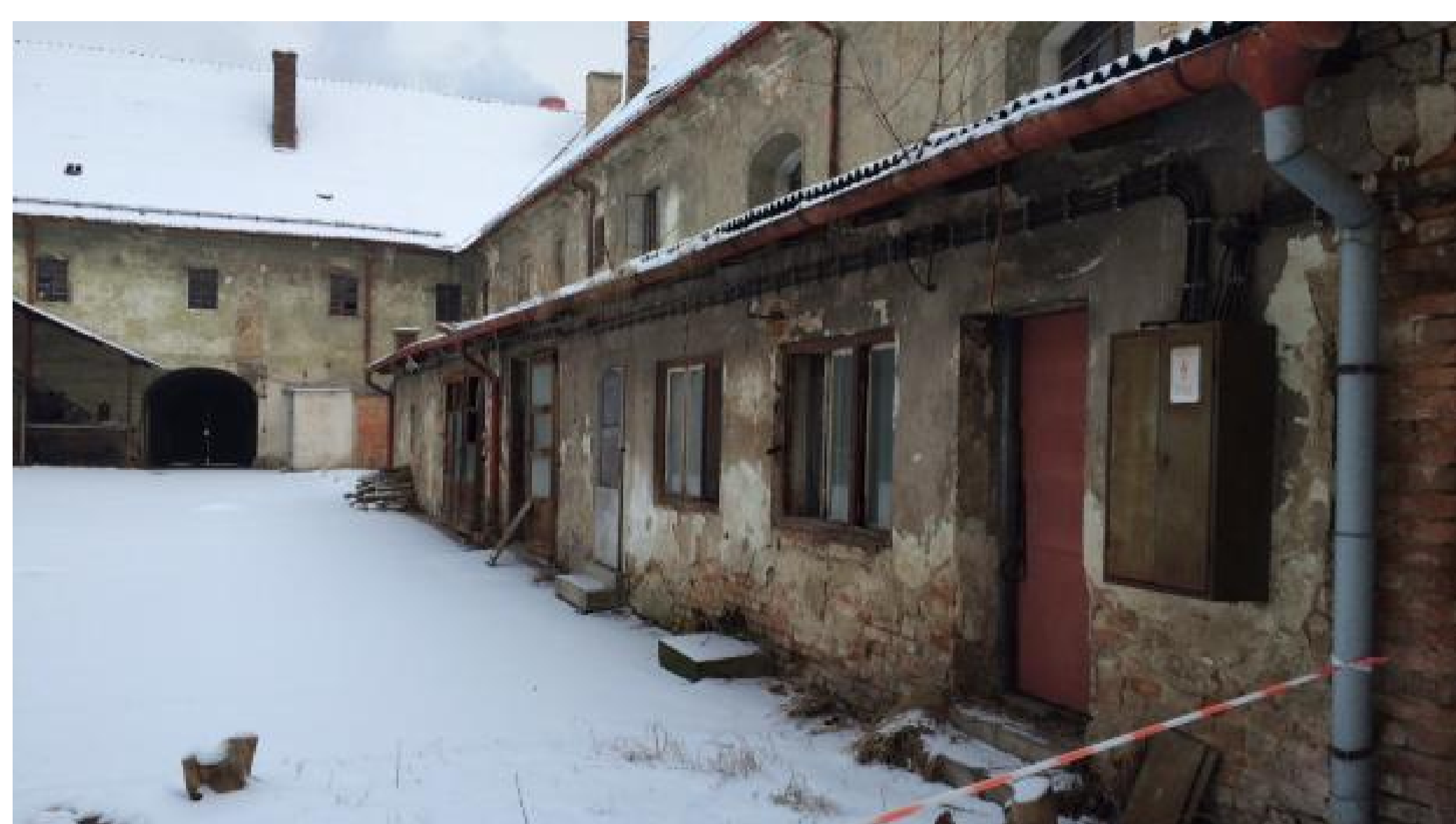
Nádvoří káznice

Tento týden obsadili objekt dělníci – bývalé vězení dostane nové sociální zařízení nebo elektroinstalaci.