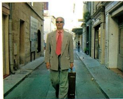
Il sort de chez lui à 8 h 40. Il va au travail.