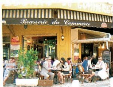
À 12 h 30, il déjeune à la Brasserie du Commerce.