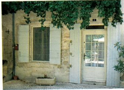
Lucas habite 5, rue Nostradamus, à Saint-Rémy-de-Provence. Il est célibataire.