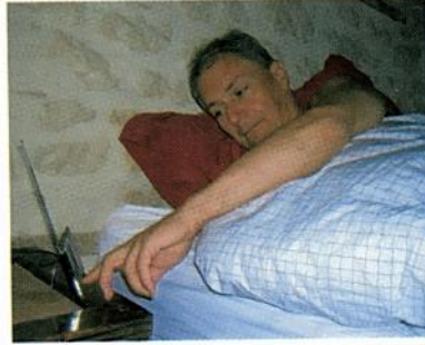
Il se réveille à 7 heures, mais il se lève à 7 h 15.