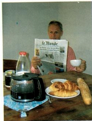
Il prend son petit déjeuner. Il lit le journal.