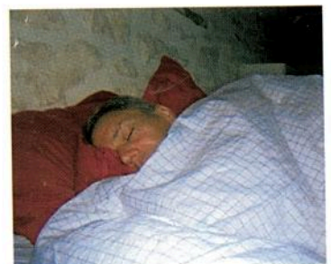
Il se couche à 11 heures du soir. Il dort jusqu'à 7 heures du matin.