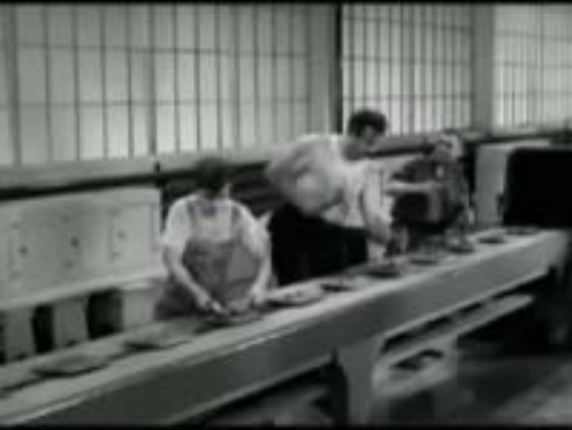
Charlie Chaplin Modern times (1936)