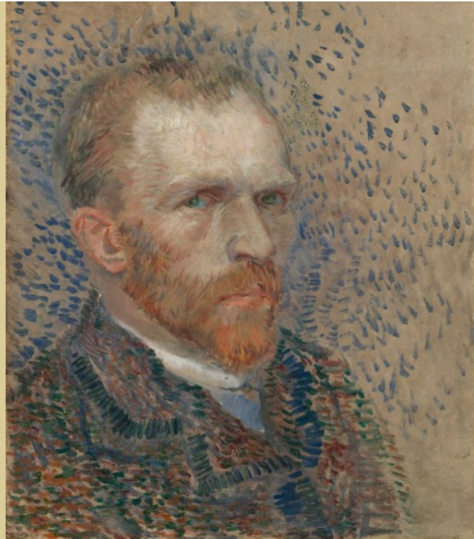
Vincent van Gogh, Self-Portrait , 1887