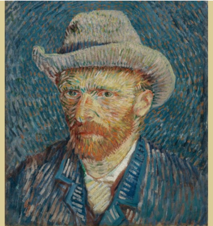
Vincent van Gogh, Self-Portrait with Grey Felt Hat , 1887