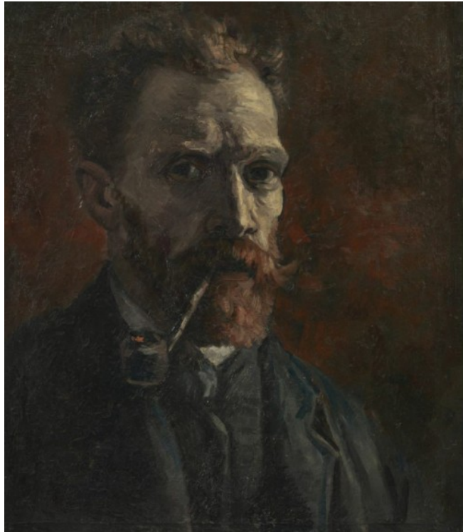
Vincent van Gogh, Self-Portrait with Pipe , 1886