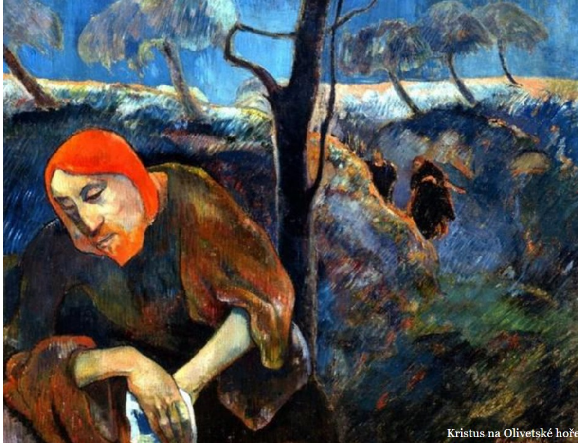
Kristus na Olivetské hoře