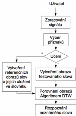
Obrázek: Blokové schéma klasifikátoru slov