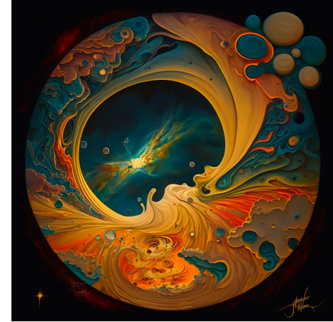
Obrázek: Midjourney painting Midjourney