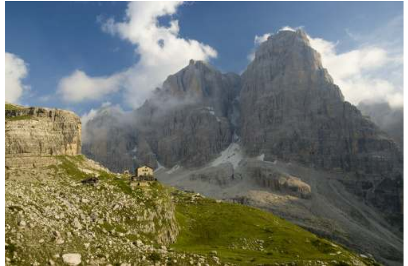
JPEG z RAW