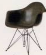
Charles Eames 1949