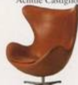
Arne Jacobsen 1958