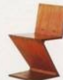
Gerrit Rietvelt 1934