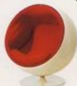
Eero Arnio 1965