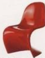
Verner Panton 1960