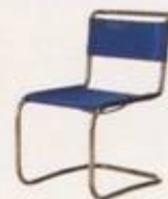
Mart Stam 1926