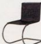
Ludwig Mies van der Rohe 1929