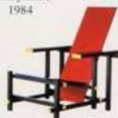
Gerrit Rietvelt 1917, 1918