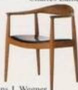
Hans J. Wegner 1949