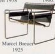
Marcel Breuer 1925