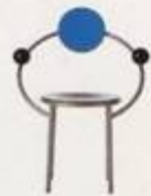
Michele De Lucchi 1983