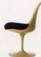
Eero Saarinen 1956, 1957