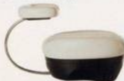
Achille Castiglioni 1970