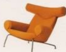
Hans J. Wegner 1961