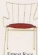
Ernest Race 1950