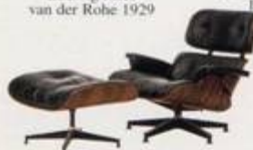
Charles Eames 1956