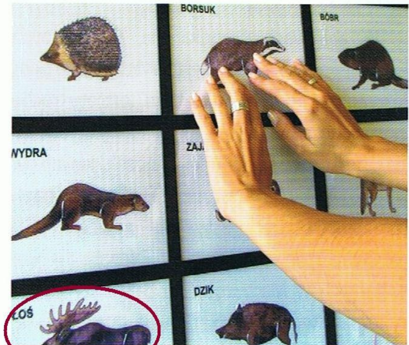
Grafi reliefowe zwierząt wykonane w Studiu