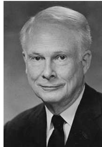
Wilson Allen Wallis (1912 – 1988): Americký matematik

Nechť je dáno r \geq 3 nezávislých náhodných výběrů o rozsazích n_1, \dots, n_r . Předpokládáme, že tyto výběry pocházejí ze spojitých rozložení. Označme n = n_1 + \dots + n_r . Na asymptotické hladině významnosti \alpha chceme testovat hypotézu, že všechny tyto výběry pocházejí z téhož rozložení.