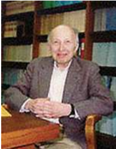
William Kruskal (1919 – 2005): Americký matematik