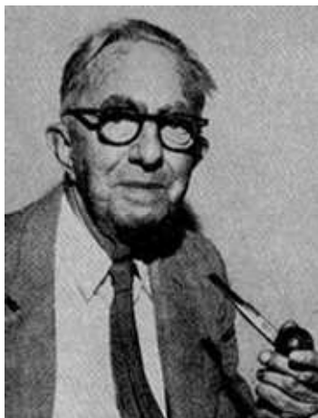
Frank Wilcoxon (1892 – 1965): Americký statistik a chemik

Nechť X_1, \dots, X_n je náhodný výběr ze spojitého rozložení s hustotou \varphi(x) , která je symetrická kolem mediánu x_{0,50} , tj.