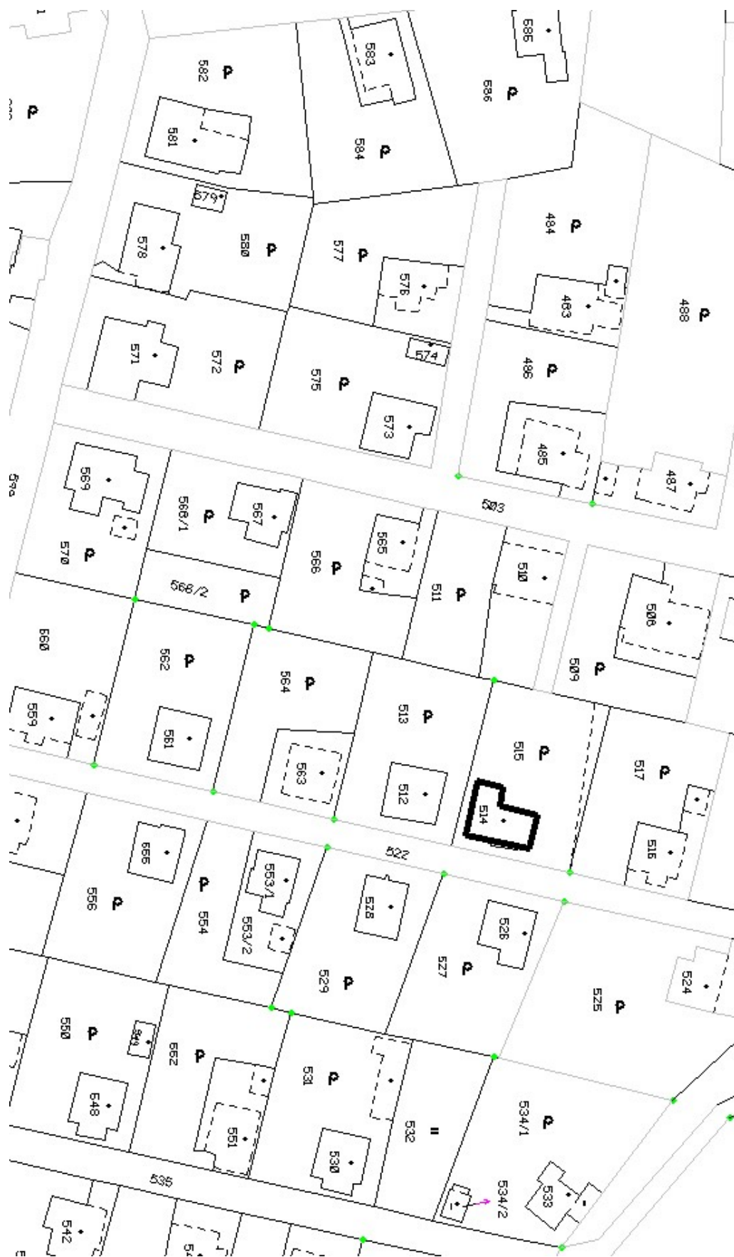
Fragment katastrální mapy s vyznačenou budovou