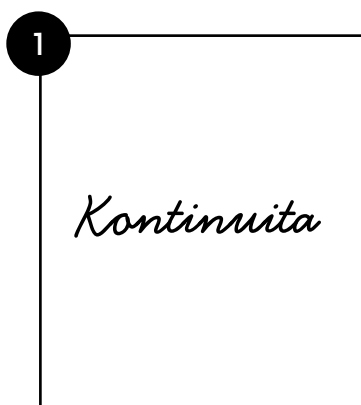
typ písma, ktoré vyjadruje pojem