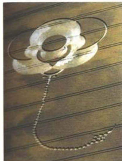
„Sting Ray“ (Rejnost). Beckhampton, Wiltshire. 21. červenec 1998. Délka cca 450 stop (136 m). Pšenice.