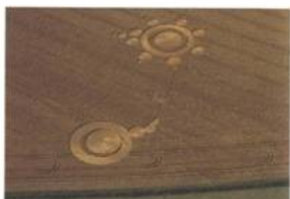
„Thought Bubble and Broach“ (Myšlenková bublina a brož). Danebury, Hampshire. 2. srpen 1998. Průměr cca 60 stop (18 m). Pšenice.