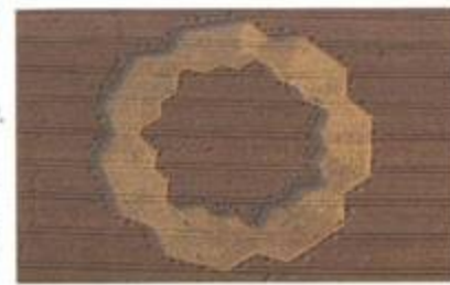
„Handkerchief with centre“ (Kapesník se středem). West Stowell, Wiltshire. 9. srpen 1998. Průměr cca 500 stop (152 m). Pšenice.