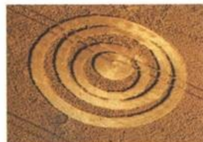
Srpky měsíce v Danebury, Hampshire. 2. srpen 1998. Průměr cca 75 stop (23 m).