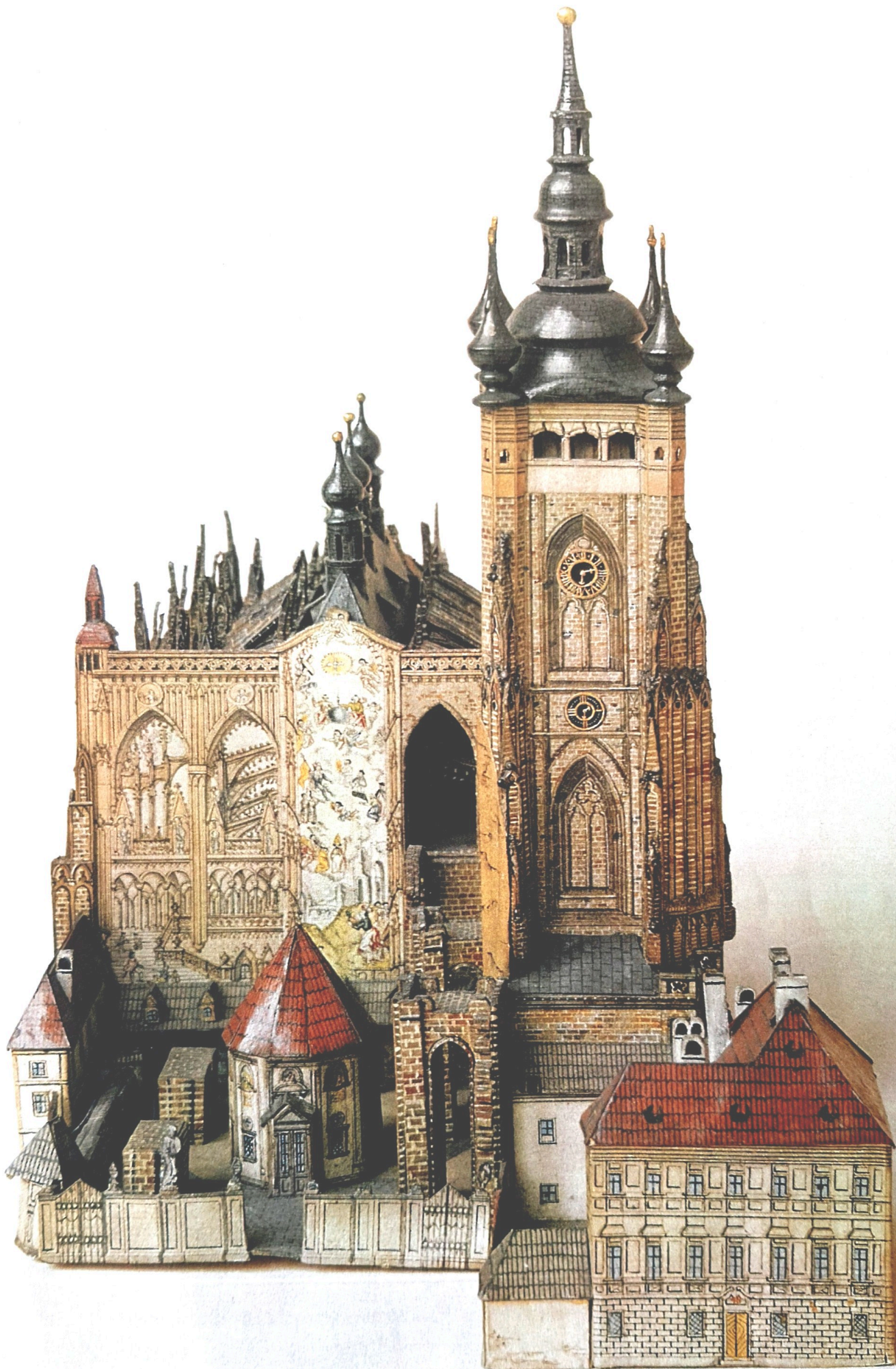
V POPŘEDÍ VPRAVO JE DŮM PROBOŠTA METROPOLITNÍ KAPITULY U SV. VÍTA, UPROSTŘED KAPLE SV. VOJTĚCHA Z DRUHÉ POLOVINY 16. STOLETÍ PŘEDNÍ KATEDRÁLY ZA POČATÉ ROKU 1673.