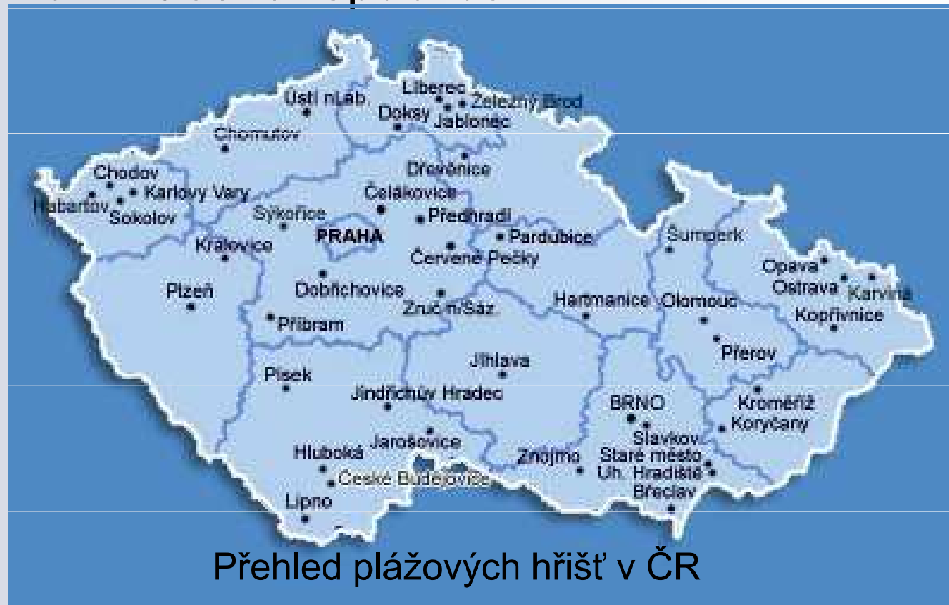
Přehled plážových hřišť v ČR