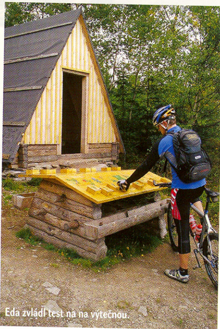
Eda zvládl test na na výtečnou.

Po krátkém občerstvení a nabažení se výhledů do okolí nás napadá zpočátku šílený