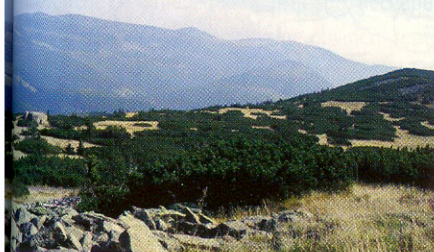
Zleva – Labská louka a bouda, Labský důl, Luční a Studniční Hora.