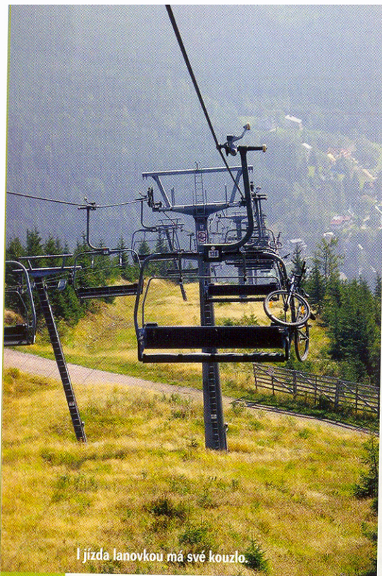
Jízda lanovkou má své kouzlo.

cestujícími. Obsluha je ale profesionální, a tak i přes naše obavy vše dobře dopadá.