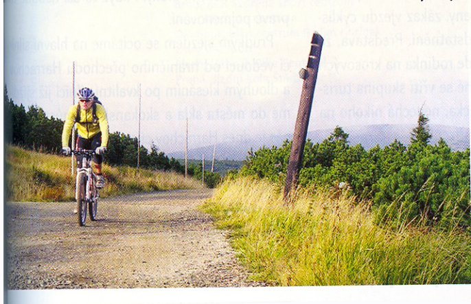
Cestou z Výrovky.

Ráno nás vítá prosluněná obloha a snídaně, za kterou by se nemuseli stydět ani v Intercontinentalu. Na rozloučenou ještě „fasujeme“ výborný domácí sirup, který s našimi chemickými produkty v rezervoárech nelze vůbec srovnávat. Chvilí si ještě užíváme zbytek sjezdu, ale přece jen jsme v horách, takže se v další minutě opět škrábeme do kopce po žluté značce. Stoupání je to nudné a graduje rovnou cestou kolmo vzhůru směrem k boudě Na pláni. Naštěstí má dnes Krakonoš asi dobrou náladu a stáčí naše kola vlevo po vrsťevnici, po které přijíždíme do Špindlerova Mlýna. Potřebujeme se dostat na Medvědí a v podstatě máme dvě možnosti - buď využít tzv. vodovodní cestu (červená značka), což ale zase znamená jet do hodně prudkého a nudného kopce, nebo lanovou dráhu. Lenost a zvědavost vítězí nad vidinou dalšího tlačení kola a za chvíli již v rukou třímáme jízdenky do nebes. Překvapivě nasedáme bez kol, ty zůstávají v dolní stanici a (snad) dorazí za posledními