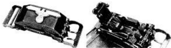
Střílející přezka SS

Další technické řešení měly jednotky SS. Konkrétně se jednalo o tzv Marquisovy střílející přezky k opaskům. Viz obrázek níže.