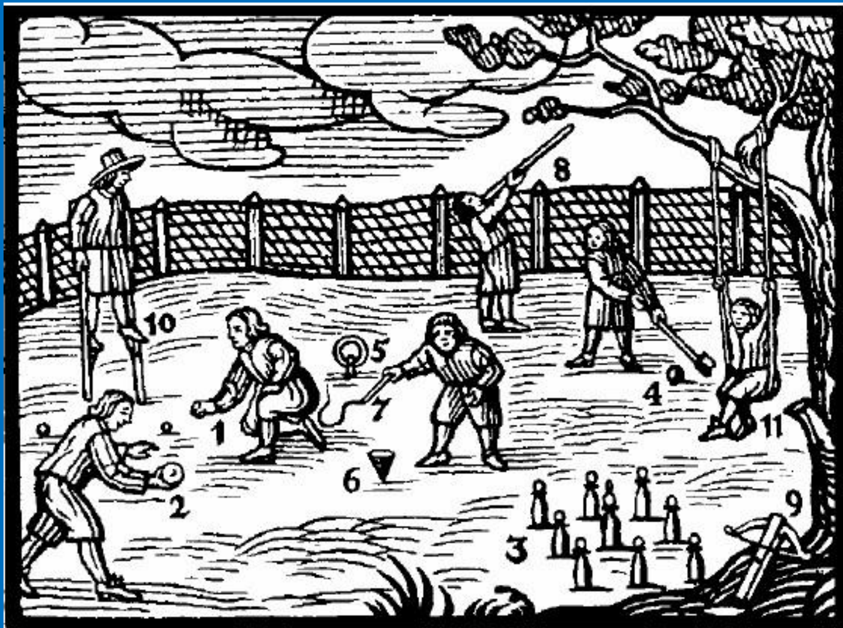
Informatorium školy mateřské