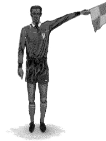
Volný kop - signál po přerušení hry