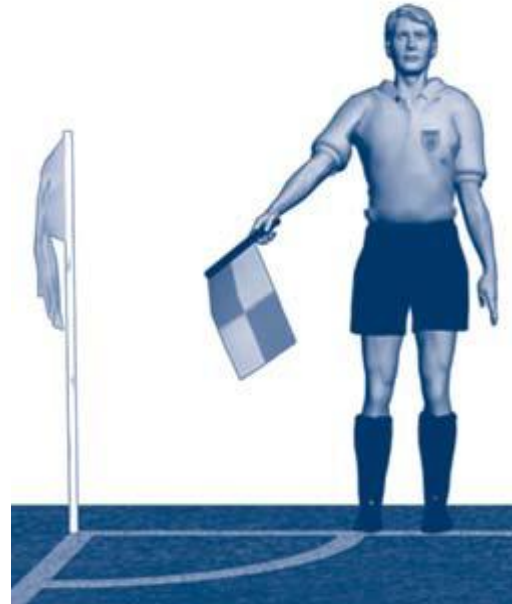
3. fáze kop z rohu