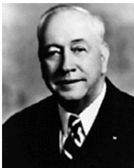
Obr. 1 W. G. Morgan