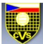
Obr. 9 Logo ČVS

Český volejbalový svaz byl založen v roce 1921 spolu s basketbalovým svazem (Československý volejbalový a basketbalový svaz), až v roce 1946 byl osamostatněn. V současné době má přes 50 tisíc členů v celé České republice.