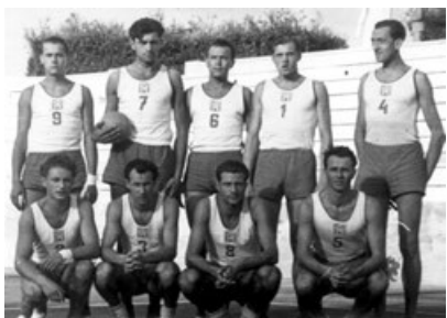
Obr. 8 Czechoslovakia Gold Medal Team

V současné době pořádá CEV dvě nejvýznamnější klubové evropské soutěže ve volejbale mužů a žen - CEV Champions League a Indesit European Champions League, které se pořádají každý rok.