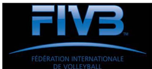
Obr. 2 Nové logo FIVB, 2010

Hlavní Světovou mezinárodní volejbalovou organizací je FIVB (The Fédération Internationale de Volleyball). FIVB je sdružením podle švýcarského práva a byla založena v roce 1947 v Paříži a sídlí v Lausanne. Československo bylo jednou ze 14 zakládajících zemí, které se zúčastnily ustavujícího sjezdu v Paříži.