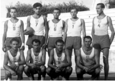
Obr. 8 Czechoslovakia Gold Medal Team

V současné době pořádá CEV dvě nejvýznamnější klubové evropské soutěže ve volejbale mužů a žen - CEV Champions League a Indesit European Champions League, které se pořádají každý rok.