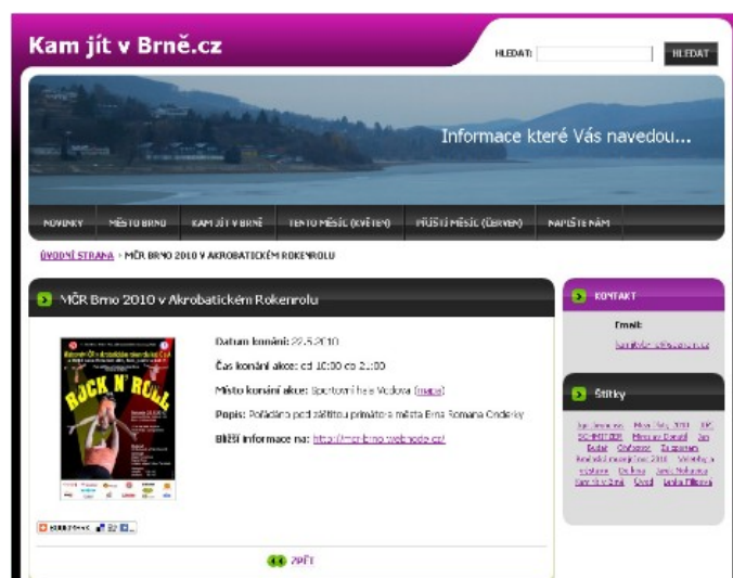
Obr. č. 4. : Propagace - Kam jít v Brně