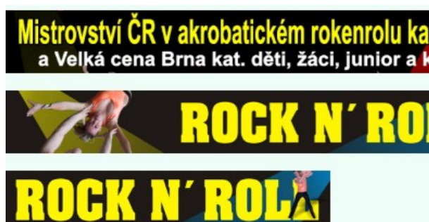
Obr. č. 3.: Medializace - internetu