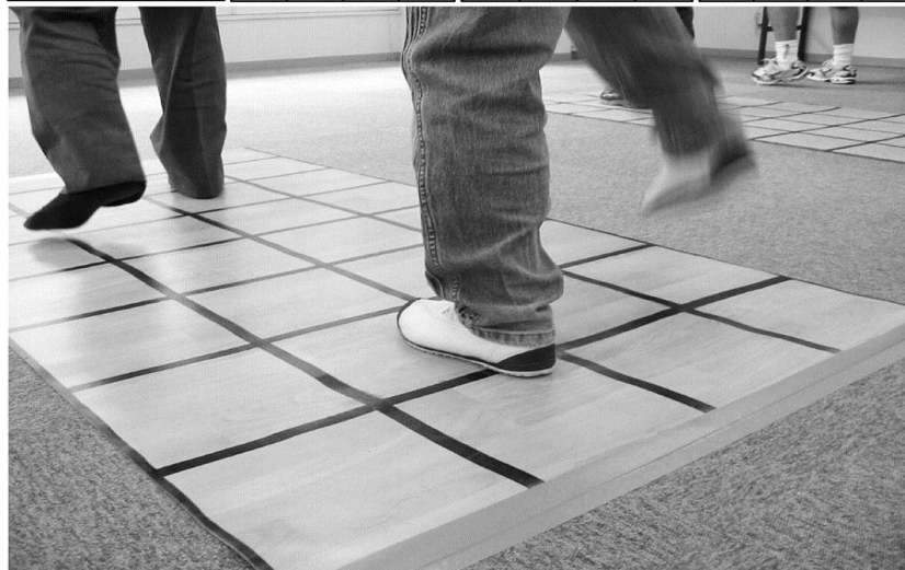
Ryosuke Shigematsu et al. J Gerontol A Biol Sci Med Sci 2008;63:76-82