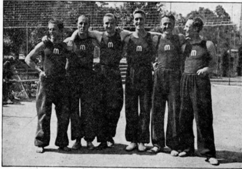
Obr. 130. I. volleyballové družstvo Masarykovy kolej z r. 1933. Masarykova kolej stavi každoročně několik prvotřídních družstev a drží i mistrovství kolejí.