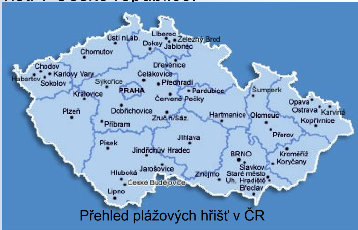
Přehled plážových hřišť v ČR