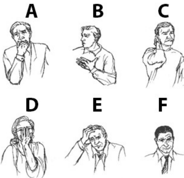
NEVERBÁLNÍ PROJEVY - ÚKOL

Papír v ruce (nejlépe čtvrtka výkresu) je současně i jistou neverbální oporou v jinak prázdném prostoru. Znovu však nutno zdůraznit, že musí hrát funkční roli obdobně jako rekvizita pro herce na divadle. Jakmile by si řečník s rekvizitou jen tak v prstech pohrával, většina posluchačů by začala vnímat spíše hrátky s papírkem, než slova řečníka. Navíc by taková hra byla vnímána a interpretována jako rušivý projev pramenící nejspíš z nejistoty a nervozity. Obdobnou „oporou v prostoru“ může být také například tužka, pokud ovšem poslouží jako ukazovátko. Jakmile si s ní řečník pouze pohrává v ruce, žmoulá ji, či přehazuje z jedné dlaně do druhé, posluchači přestanou poslouchat a počnou se věnovat pozorování rozličných pohybů a vývrtek tužky.