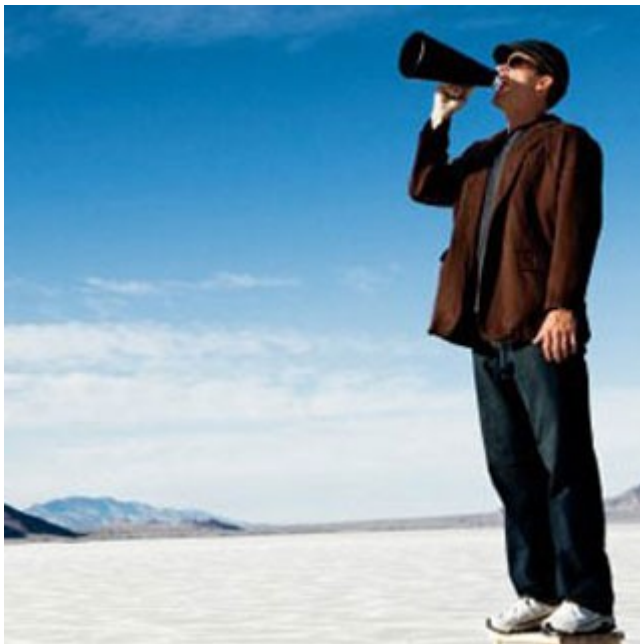
PR JAKO NÁHRADA REKLAMNÍ KAMPANĚ

V managementu sportu, obdobně jako v jiných oblastech, je žádoucí, aby tyto zásady převzali vedoucí pracovníci do svého vystupování a jednání. Zvládat základní pravidla etikety, pracovat na tvorbě žádoucího prvního dojmu i osobní image, umět oslovit a přesvědčit, zlepšovat rétorické dovednosti, korigovat nežádoucí verbální a neverbální projevy a ovládat zásady efektivní komunikace je potřebné a přínosné.