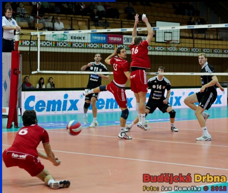
Budějcká Drbna