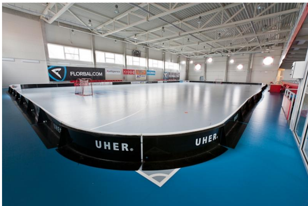
Obrázek č. 6: Sportovní hala SportPoint