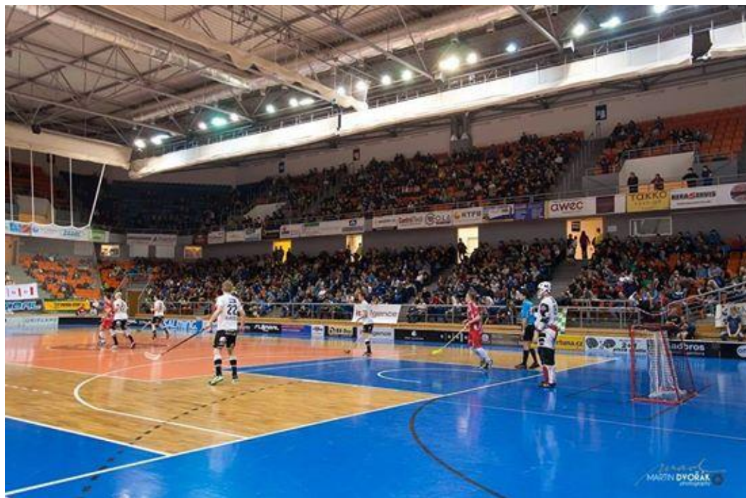
Obrázek č. 7: Městská sportovní hala Vodova (nová)